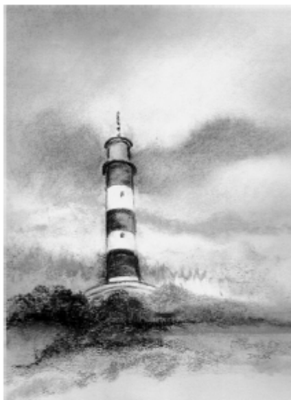
« Au bout du monde », de Demise SIQUIET