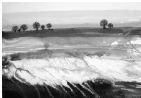
« Ruissellement », de Mireille PARIS.