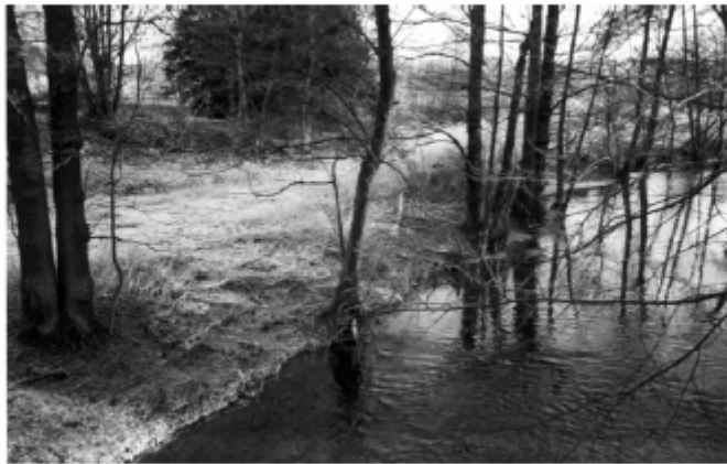
« Frima » de Jo ACTON.