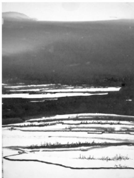
« Marais lointains », de Mireille PARIS