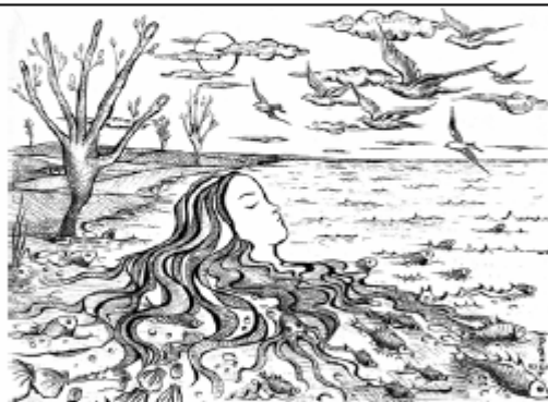
« Liberté de la mer », d'Adée DEMANET