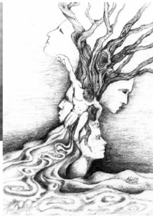
De Noëlle LECUYER.

Toutes ces œuvres (et bien d'autres) illustrent l'essai d'André LIBERT ( voir page 4)