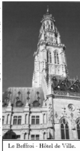
Le Beffroi - Hôtel de Ville.