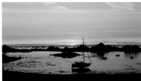
« Crépuscule » de Géhel.