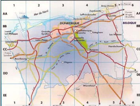
Pour situer Dunkerque et ses voies d'accès.

Bien que ravagée par la guerre, Dunkerque a gardé, rénové et exploité un patrimoine important.