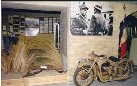
Mémorial du Souvenir.