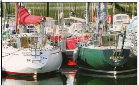
Deux vues du port de plaisance

Photos et documentations d'après la brochure de l'Office du Tourisme de Dunkerque—Dunes de Flandre (voir pages suivantes) Voir aussi www.lesdunesdeflandre.fr