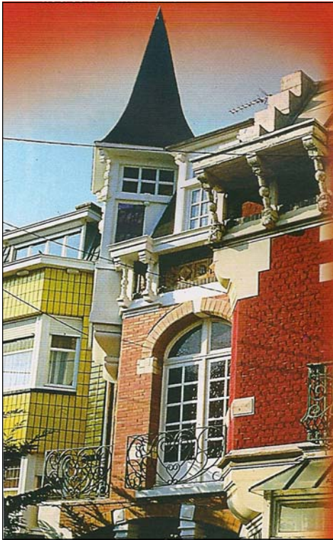
Un patrimoine urbanistique.