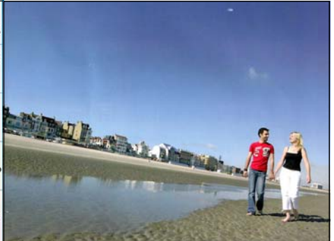
La plage de Dunkerque.