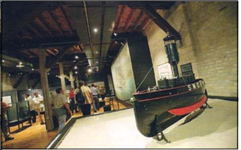
Musée de la Marine.